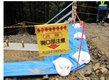
あぶない場所の例