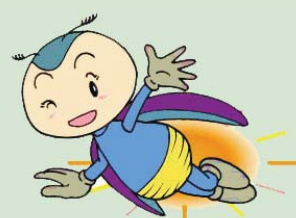
小石原川ダム イメージキャラクター あかりちゃん

イベント保険(傷害保険)に加入しますので、別途申込書に住所、氏名及び連絡先などを記入のうえ提出していただきます。電話で事前予約いただく際にご案内します。