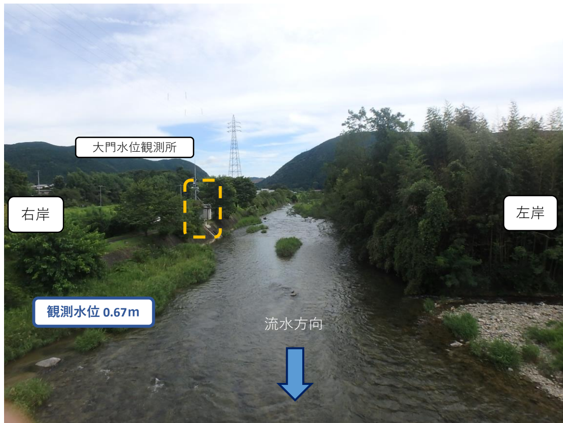
大門水位観測所地点 現地写真（洪水後）（令和4年7月4日16時頃撮影）