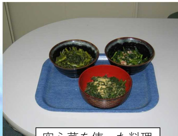
空心菜を使った料理