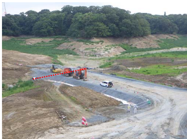
横断暗渠敷設完了