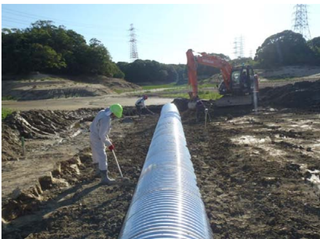
横断暗渠敷設状況