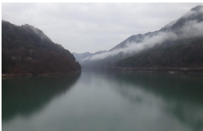
ダム諸量データ(平成30年12月3日 0時状況)