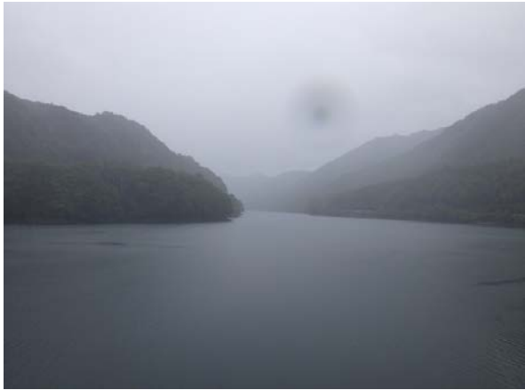
ダム諸量データ(令和元年10月4日 0時状況)