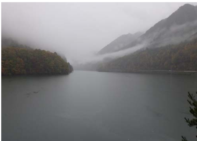
ダム諸量データ(令和2年11月2日 0時状況)