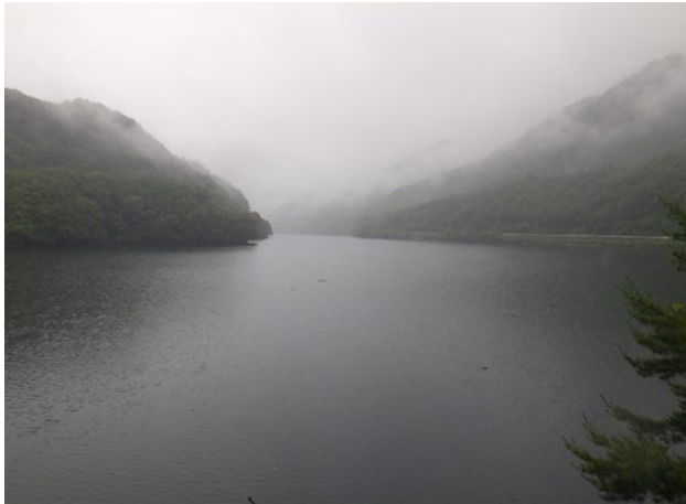
ダム諸量データ(令和3年7月2日 0時状況)