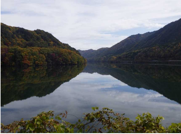
ダム諸量データ(令和3年11月1日 0時状況)