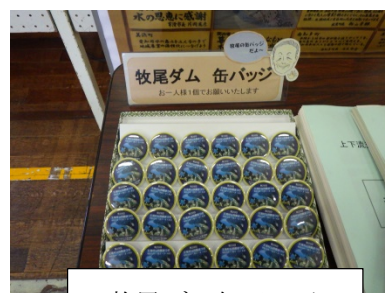
牧尾ダム缶バッジ