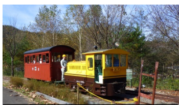
王滝森林鉄道体験乗車会