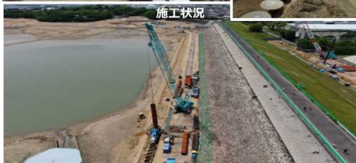
鋼管杭工法による堤体補強