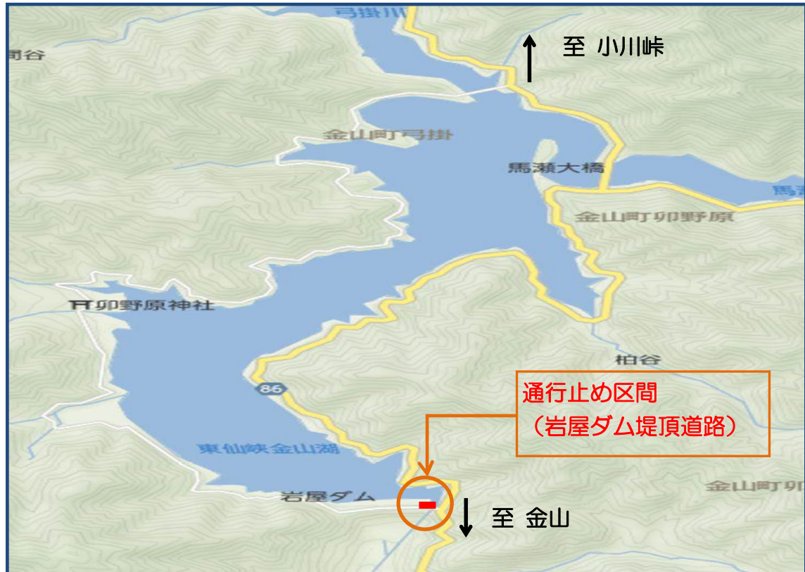
通行止め区間 概要図