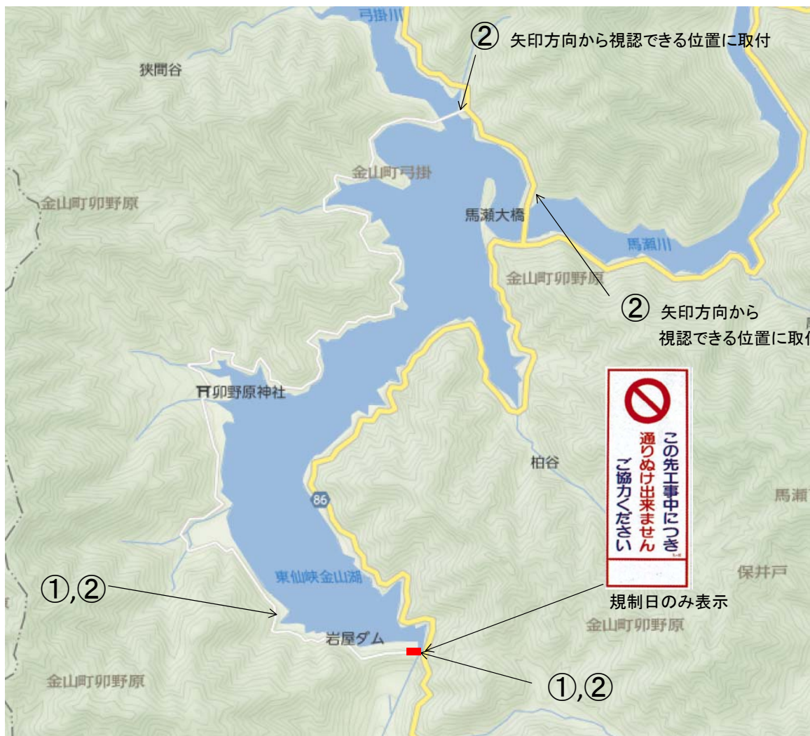
②通行止予告板 4枚 通行止め当日は(予告)部分を覆う。