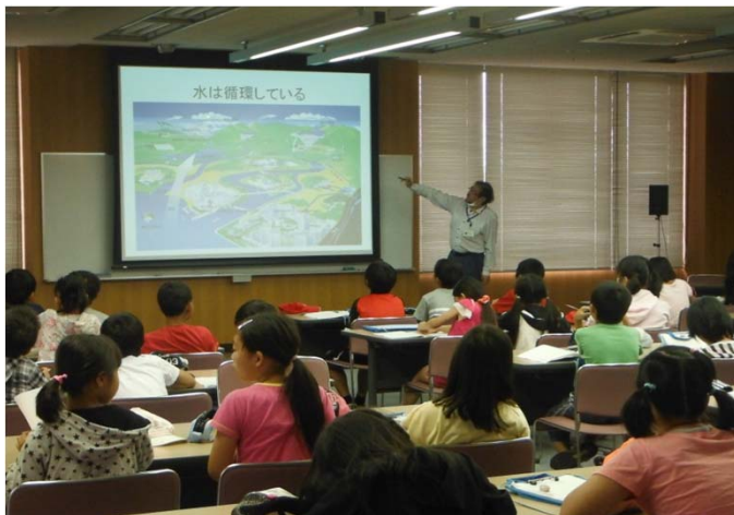
水の循環について説明

この見学会は、4年生の授業「水の旅」の一環で、川の水が水道水になり、家庭排水から下水処理後また川へ返すまでを学習することを目的に行われたものです。