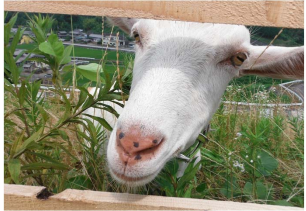
好物はツタ性の葛で~す