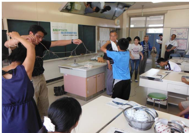
サツキマスの漁法