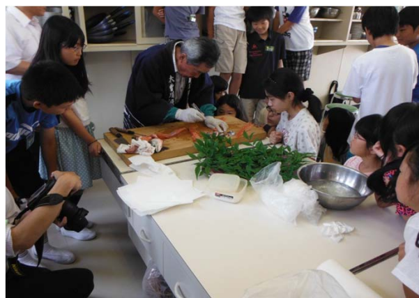
おいしい刺身に調理