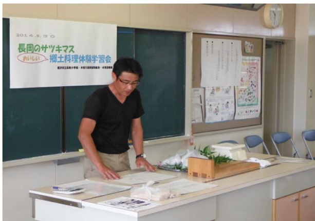
木曾川漁協大川主任によるサツキマス講座

学習会のあとは、漁業協働組合の方々が調理したサツキマスの刺身と炊き込みご飯に舌づつみを打っていました。