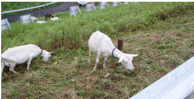
人にとって厄介な雑草もヤギさんたちの好物です

美濃加茂管理所では、蜂屋調整池において6月～9月の間、月に2、3回「ヤギさん除草隊」による除草を実施しました。一昨年まで、人力で除草していましたが、昨年の試行で、ヤギが植物の新芽を食し環境を整えることで、繁茂抑制の効果があり、堤体がきれいになることが確認されたので、今年も実施いたしました。