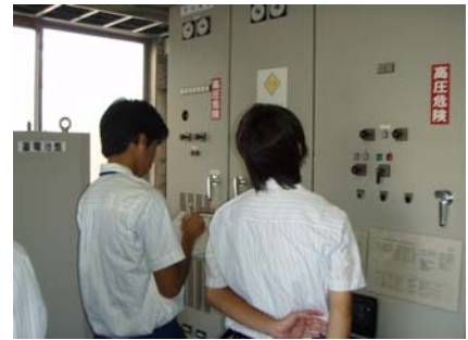
美濃加茂管理所における実体験（鈴鹿高専）

2回目は8月19日(月)～30日(金)の2週間で、三重大学(生物資源学部)の2名です。