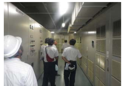
弥富管理所における実体験（三重大）

最終日には、インターンシップを終えて報告会をしていただきましたが、それぞれに、きめ細かい水管理のもとに都市用水(生活用水・工業用水)や農業用水が送られていることを実際に知ることができたことや塩分測定、流量測定など、教室での机上の勉強だけでは経験できない実体験が出来て良かったと言うことが報告されました。