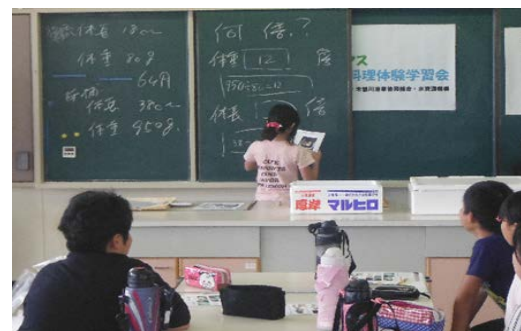
帰ってきた魚は何倍？