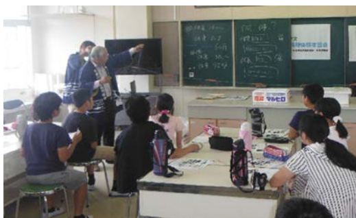
網による漁の方法