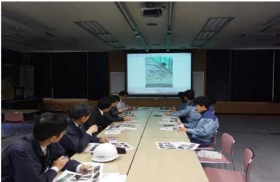
機能診断調査結果の報告

参加された方からは、ゲート設備の現状や更新整備の内容を見ることができて良かった、機能診断結果を更新計画に繋げていただきたいなどの意見が出されました。