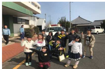
警報車体験を終えた児童