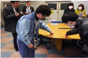
非常通報装置の確認

訓練後、同警察から国民保護法の趣旨や仕組み、国民保護の流れと指定公共機関の役割等について講話があり、同法に関する知識を深めることができました。