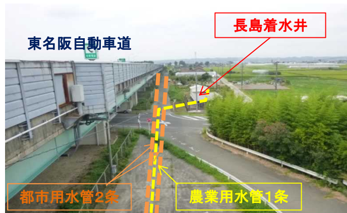
工事施設箇所全景

この内、農業用水は桑名市長島町の農地に供給していますが、木曾川水管橋において施設更新や調査を行おうとすると一時的に断水し管内を空にする必要が生じる場合があります。