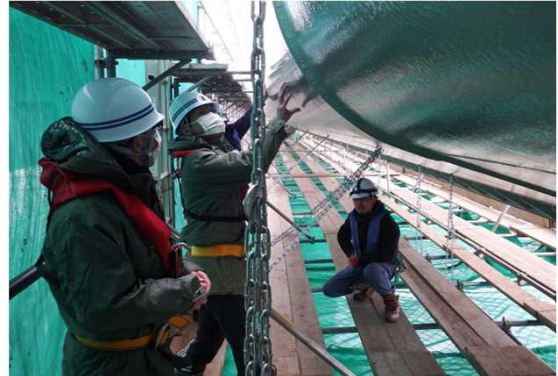
ゲート扉体の状態確認