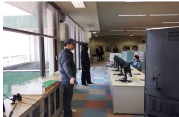
テロリストが侵入！