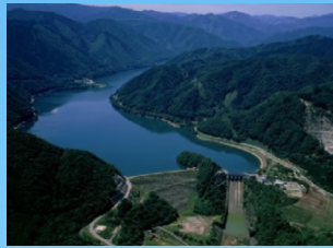
牧尾ダム 長野県木曾町・玉滝村

このコレクションシートの裏面に5つのダムカードを集めた方には、5つ目に訪ねられたダムにてそのダムの特製記念缶バッジを進呈します。