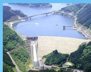
阿木川ダム 岐阜県恵那市