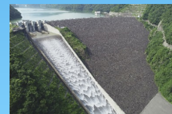
徳山ダム 岐阜県揖斐川町