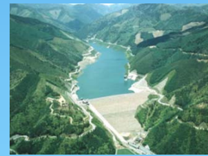
味噌川ダム 長野県木祖村