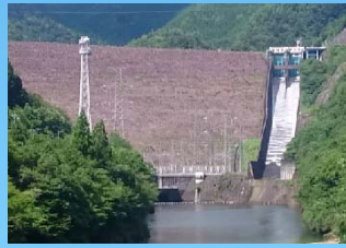
岩屋ダム 岐阜県下呂市