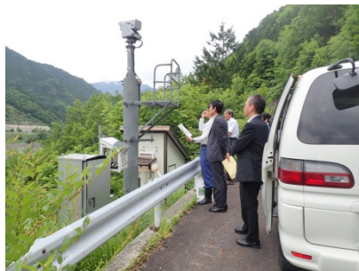
矢詰原石山法面状況説明