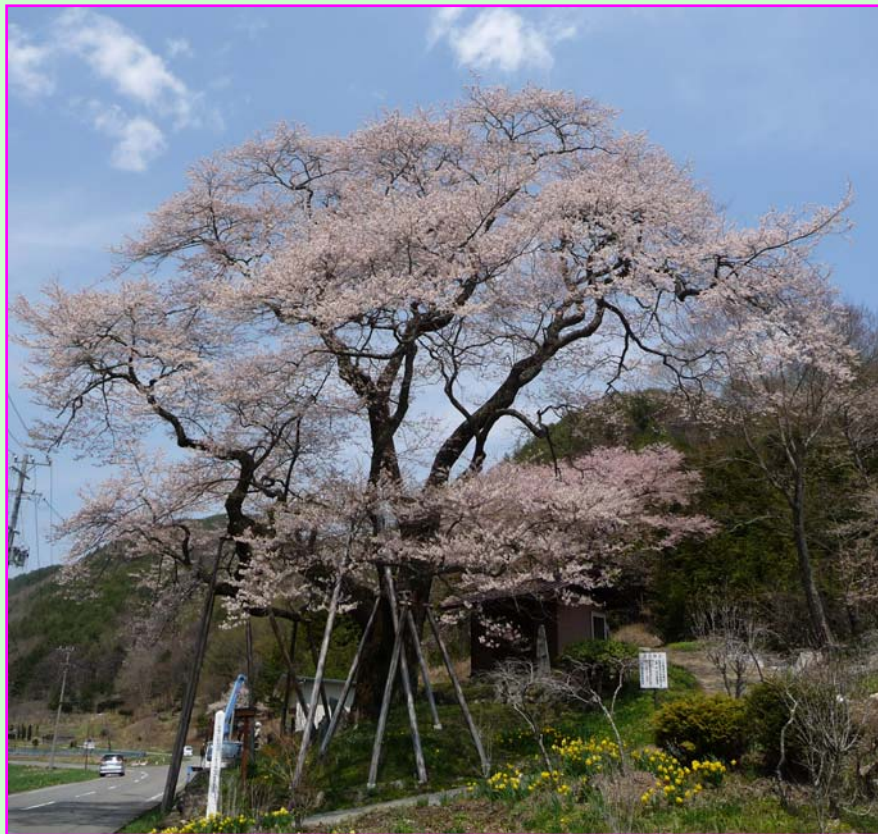
① 菅の十王堂 エドヒガン 木祖村指定文化財