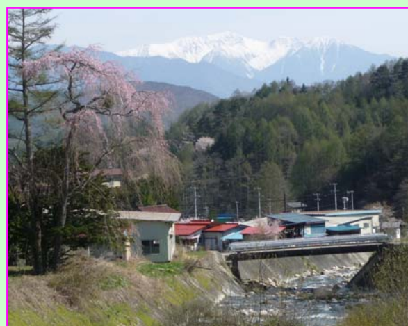
③ 細島 (ほそじま)