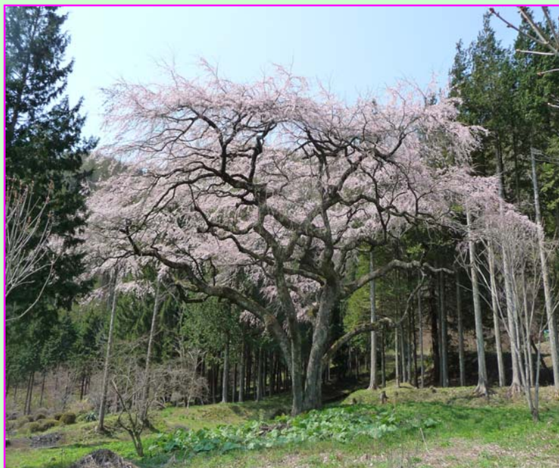
⑥ 山戸 (やまと)

木祖村の「さくら」は、例年、ゴールデンウィーク頃に見ごろを迎えます ご案内の写真は、平成 22 年 5 月 2 日～6 日に撮影したものです。