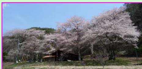
⑤ 菅・薬師堂 (すげ・やくしどう)