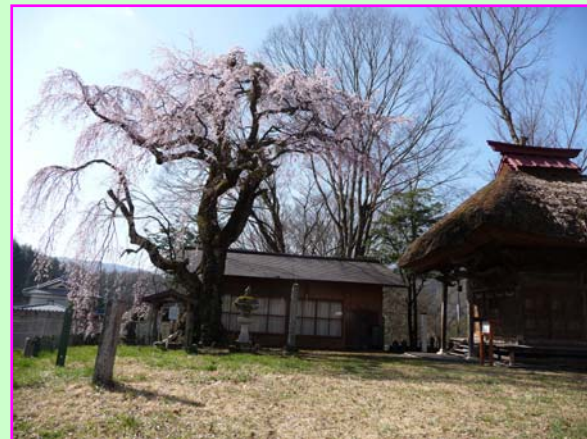
② 田ノ上観音堂 (たのうえかんのんどう) 木祖村指定文化財