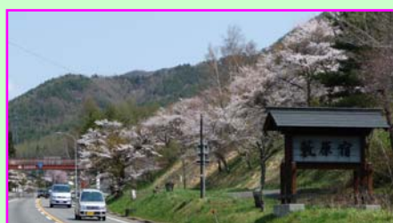
⑦ 国道 19号