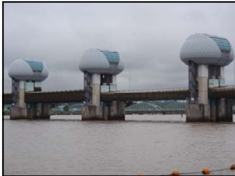
河口堰ゲート状況（下流側） 平成23年8月25日11時撮影

平成23年8月25日、前線の影響により、長良川の堰地点の流量が全開操作に移行する基準流量である毎秒800立方メートルに達したことから、洪水を安全に流下させるために、10時21分より洪水時（全開）の操作を行いました。