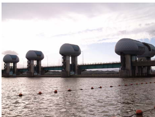
河口堰ゲート状況（下流側） 平成23年9月22日16時撮影

平成23年9月21日0時29分より全開操作を行ってきましたが、長良川の堰地点の流量が全開操作終了に移行する基準流量である毎秒800立方メートルを下回ったことから、22日15時47分に全開操作を終了しました。