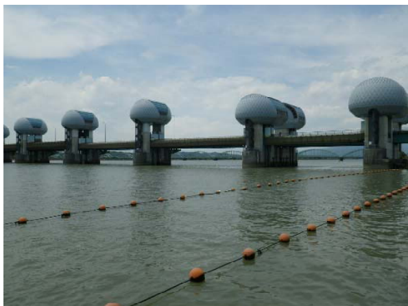
河口堰ゲート全開状況(下流側) 平成24年7月15日13時撮影

平成24年7月12日12時59分より全開操作を行い、一旦、堰地点流入量が低減したことから、14日17時22分に全開操作を終了して、アンダーフローに移行しました。その後、14日の夜遅くからまとまった降雨があり、堰地点流入量が再び毎秒800立方メートルを上回ったことから15日11時49分に全開操作を行いました。明けて16日に堰地点流入量が低減したことから16日08時08分に全開操作を終了しました。