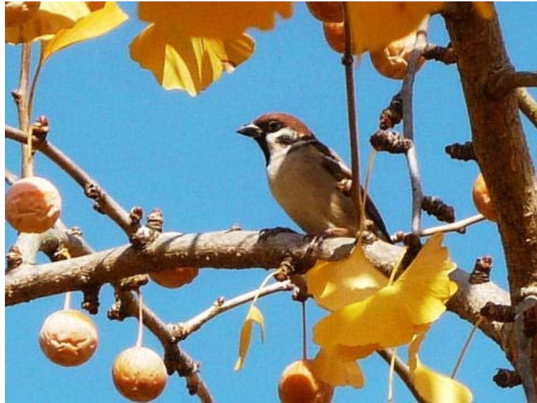
撮影：H25. 12. 1 稲沢市祖父江町にて

稲沢市祖父江町の銀杏にとまっているスズメです。チュンチュンと鳴き、冬の昼間の陽気を楽しんでいるようで、何とも微笑ましいですね。