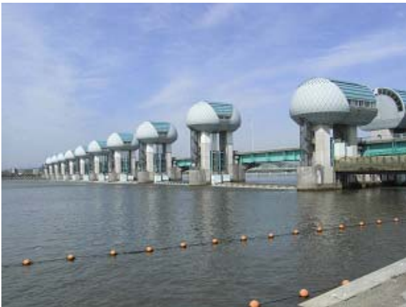
河口堰状況写真(下流側) 平成25年4月25日8時30分撮影

平成25年4月25日、前線の影響により、長良川の堰地点の流量が全開操作に移行する基準流量である毎秒800立方メートルに達したことから、洪水を安全に流下させるために、25日0時14分より洪水時（全開）の操作を行いました。その後、長良川の堰地点の流量が全開操作終了に移行する基準流量である毎秒800立方メートルを下回ったことから、25日7時32分に全開操作を終了しました。