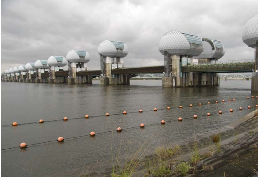
ゲートが全開中の長良川河口堰（下流側より撮影）（9月25日9時撮影）