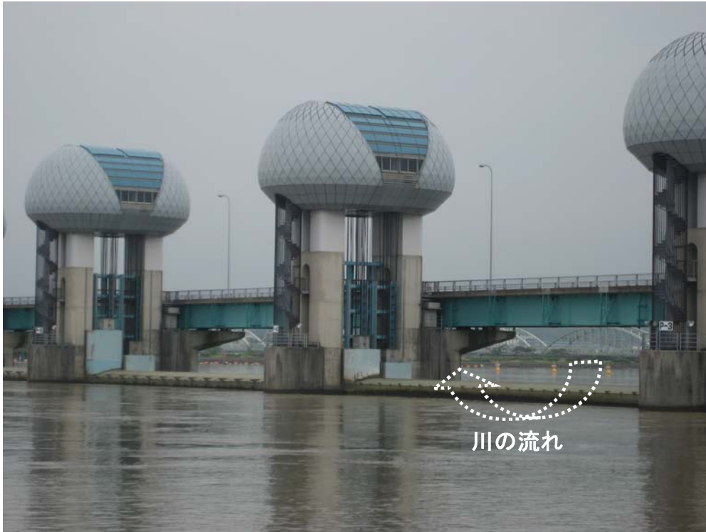
ゲート全開操作終了後の長良川河口堰（アンダーフロー操作に切り替え） 7月19日9時15分撮影