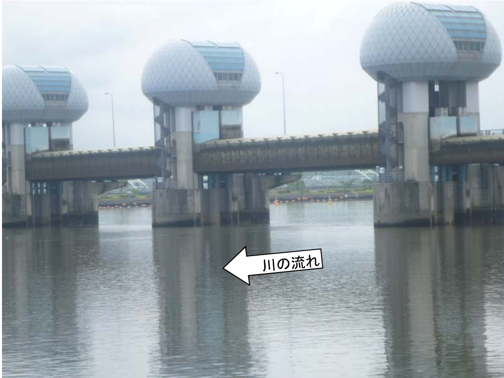
ゲート全開操作時の長良川河口堰（堰下流側）