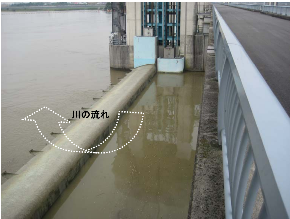
ゲート全開操作終了後の長良川河口堰（アンダーフロー操作に切り替え） 7月19日9時15分撮影