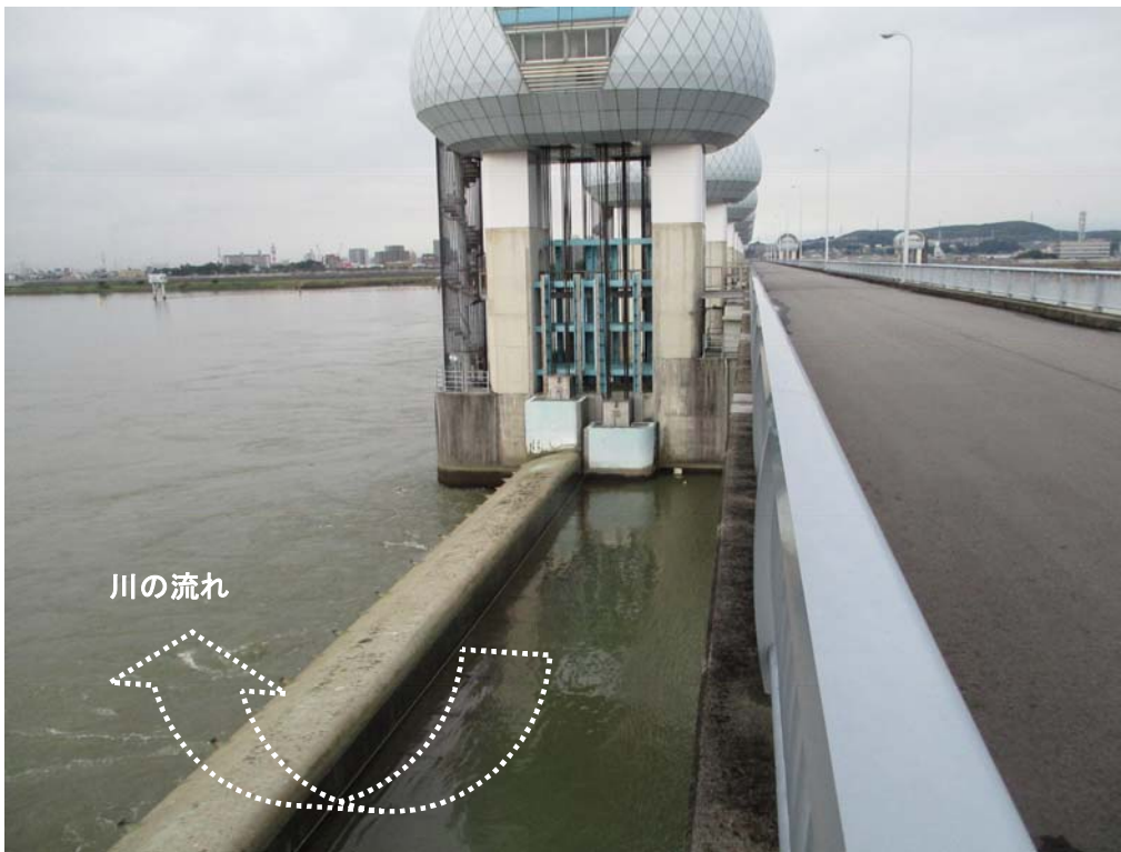
ゲート全開操作終了後の長良川河口堰（アンダーフロー操作に切り替え） 9月24日 8時撮影