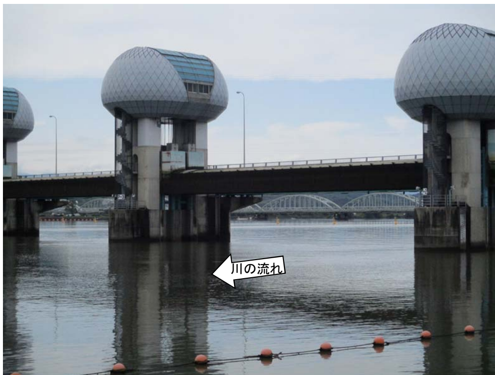
ゲート全開操作時の長良川河口堰（堰下流側）