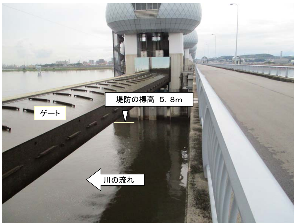
ゲート全開操作時の長良川河口堰（堤防より高い位置にゲートを引き上げ）