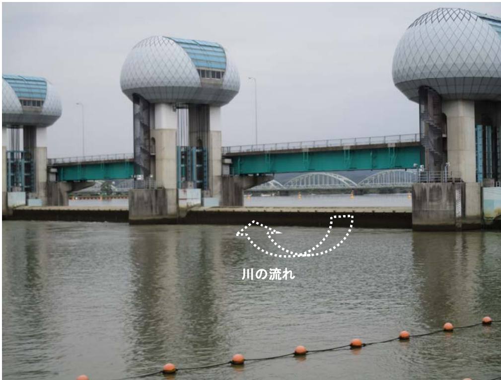
ゲート全開操作終了後の長良川河口堰（アンダーフロー操作に切り替え） 9月24日 8時撮影