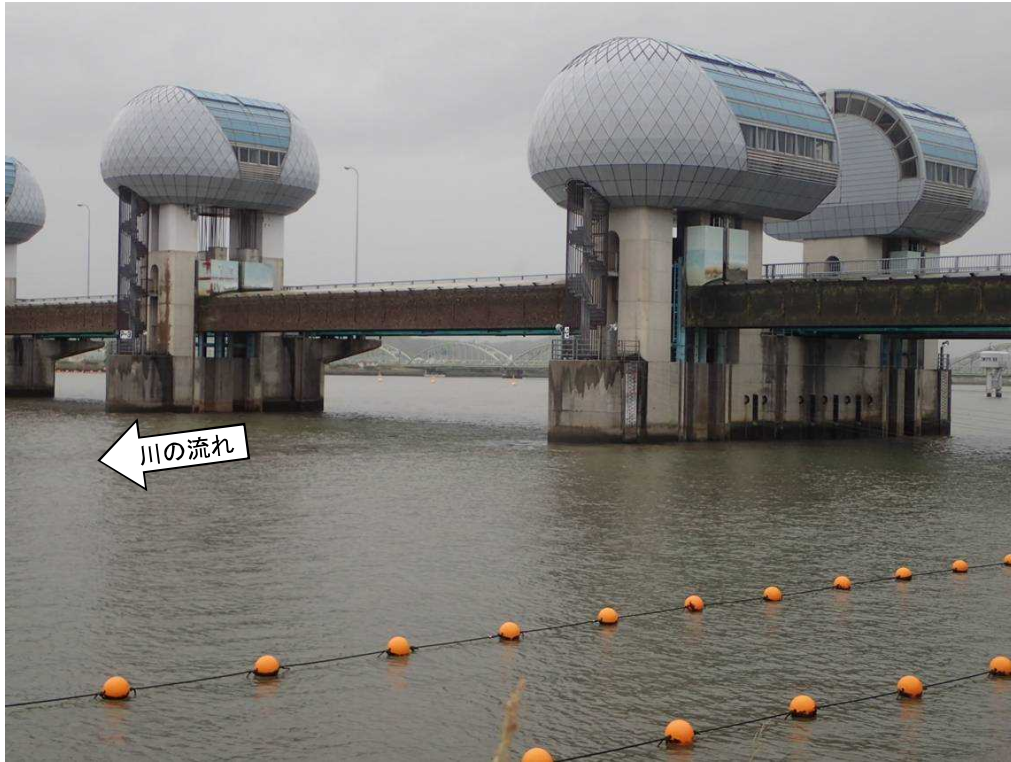
ゲート全開操作開始後の長良川河口堰（堰下流側） 7月5日 7時撮影