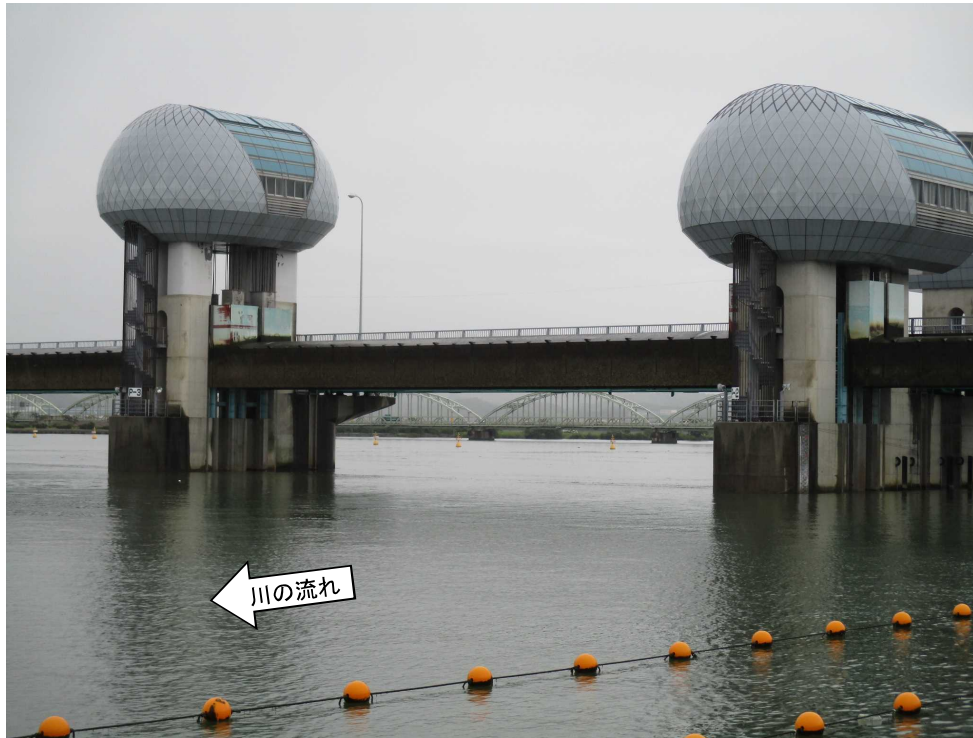
ゲート全開操作開始後の長良川河口堰（堰下流側）