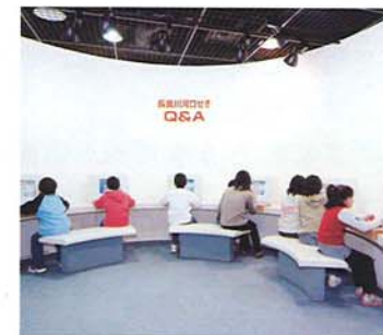
④河口堰Q&A 河口堰のあれこれをQ&A装置を使って 楽しく学べます。