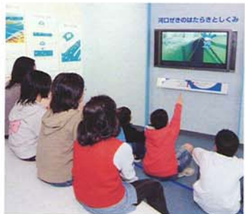
②河口堰のはたらきとしくみ 河口堰のはたらきとしくみを映像に より説明します。