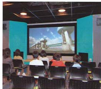
①ワイドビジョンシアター 河口堰の全容を大型映像システムで わかりやすく説明します。

長良川や河口堰についていろんな角度から見るができます。 河口堰本体が間近に見えるのはもちろん、 映像や各種パネル・模型を使ってわかりやすく説明します。