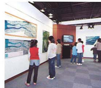
⑤フリー展示コーナー 企画展など多目的に利用できるコーナー です。