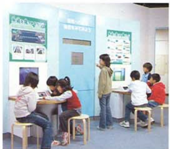
③環境への配慮 魚道をみてみよう 魚道のリアルタイム映像や魚道で 見られる魚の映像、堰周辺の映像も カメラで見ることができます。