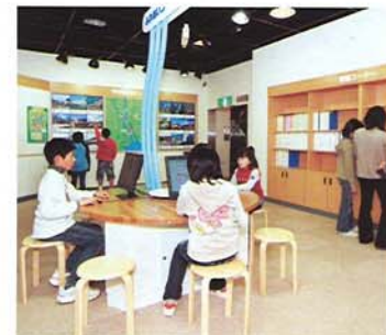
⑥ふれあいコーナー 河口堰周辺の文化施設、名所旧跡 などの紹介や、河口堰に関する資料 がご覧いただけます。