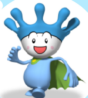
長良川河口堰イメージキャラクター あつくん