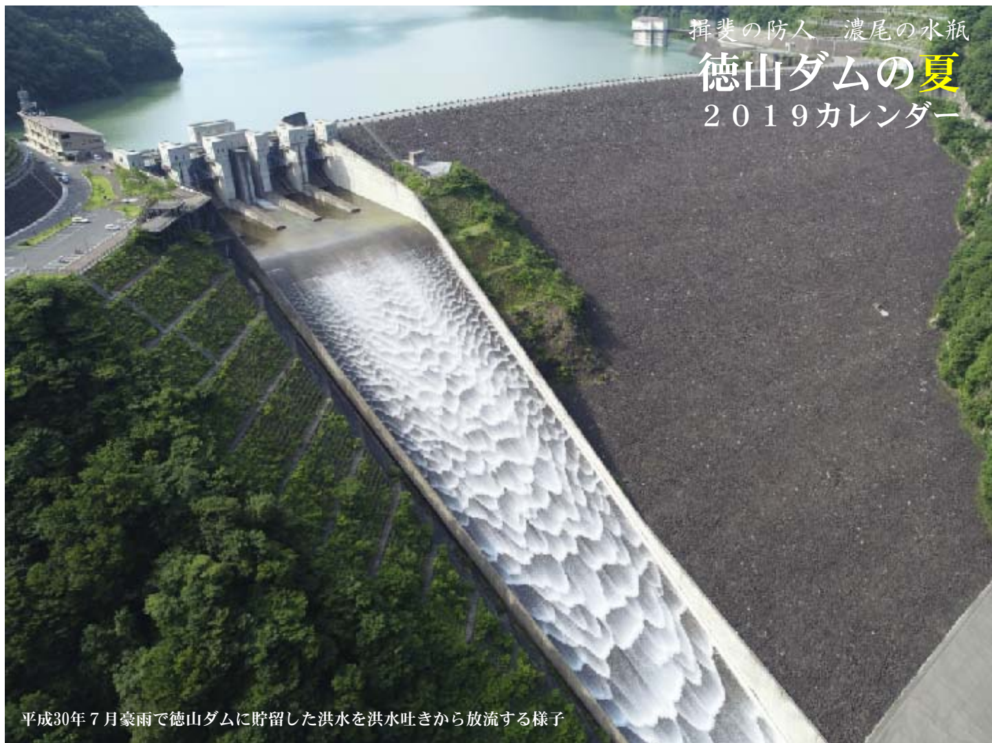
平成30年7月豪雨で徳山ダムに貯留した洪水を洪水吐きから放流する様子