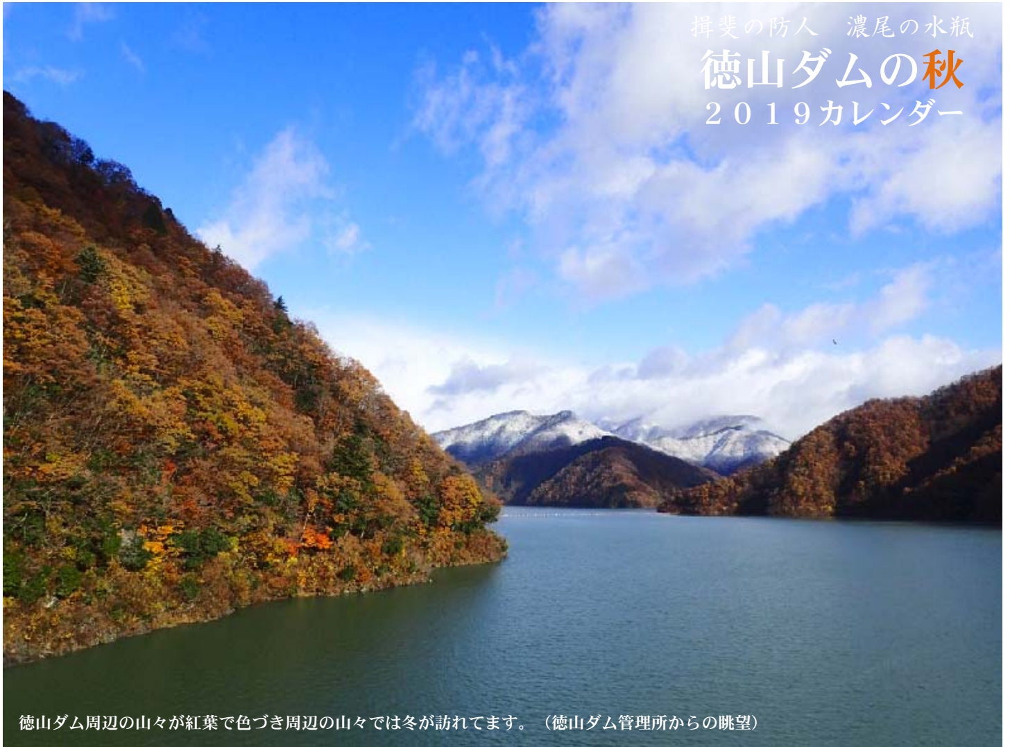
徳山ダム周辺の山々が紅葉で色づき周辺の山々では冬が訪れてます。（徳山ダム管理所からの眺望）