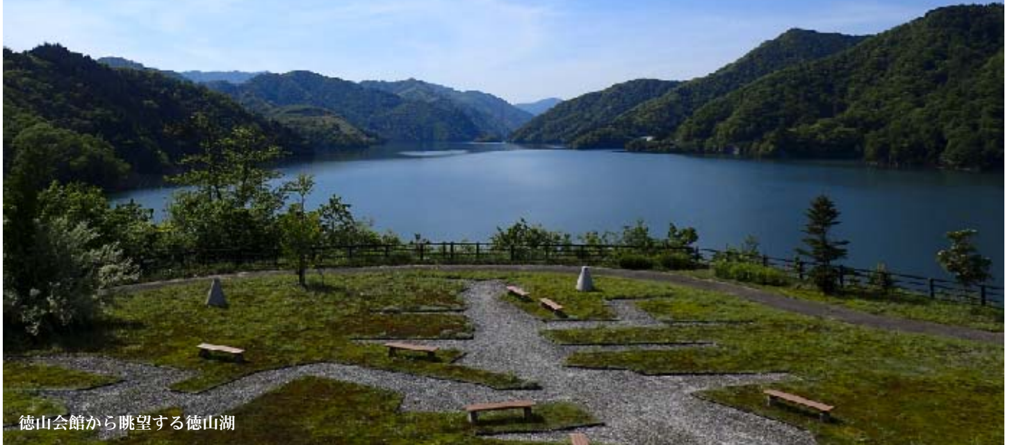
徳山会館から眺望する徳山湖