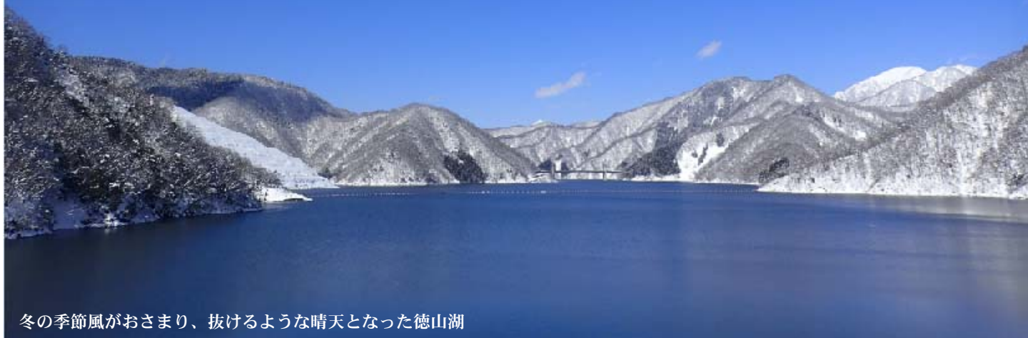
冬の季節風がおさまり、抜けるような晴天となった徳山湖