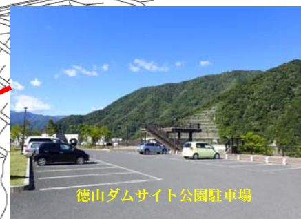
徳山ダムサイト公園駐車場

■徳山ダム管理所への進入路とダムサイト公園は、午前9時から午後5時まで開放しています。