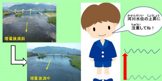
岡島地点における試行放流前、後の比較(イメージ)