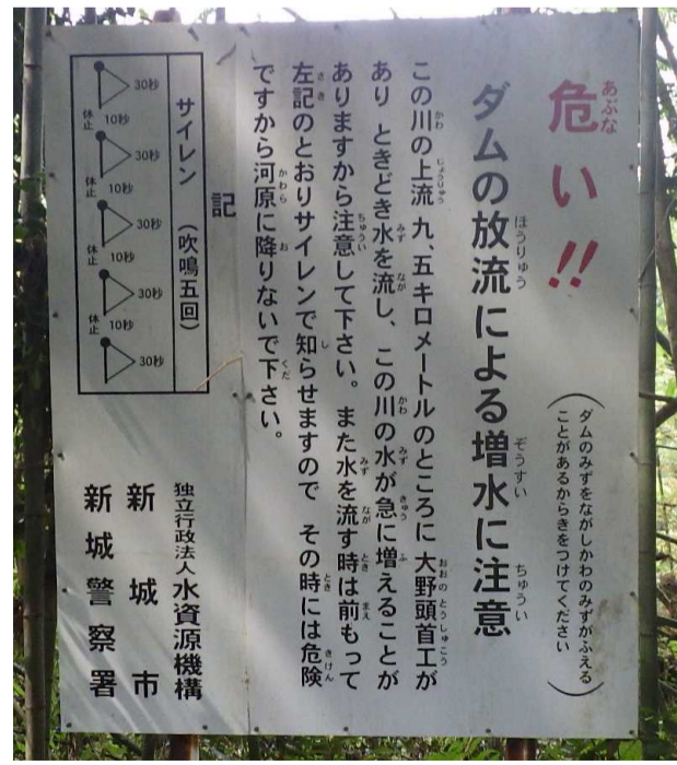
大野頭首工の一般周知立札〔大型立札〕