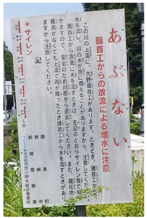
大野頭首工の一般周知立札〔小型立札〕