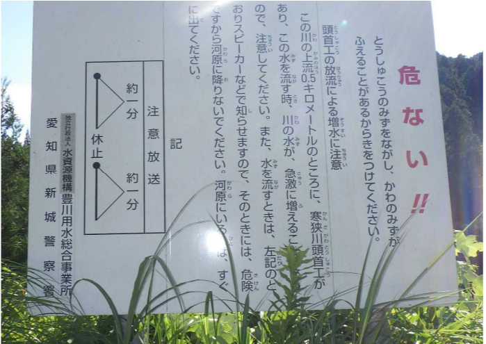
寒狭川頭首工の一般周知立札〔大型立札〕