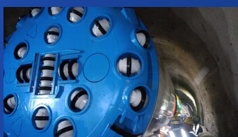
R2.3.30長い道のりの始まり