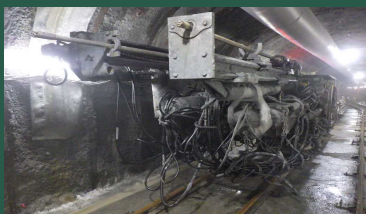
R2.5.28 上流掘削開始 (下流はR2.8.19より)