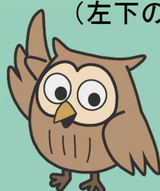
イメージキャラクター このはずく