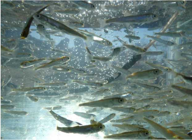
◆ 孵化後、飼育していた稚魚 (放流時)