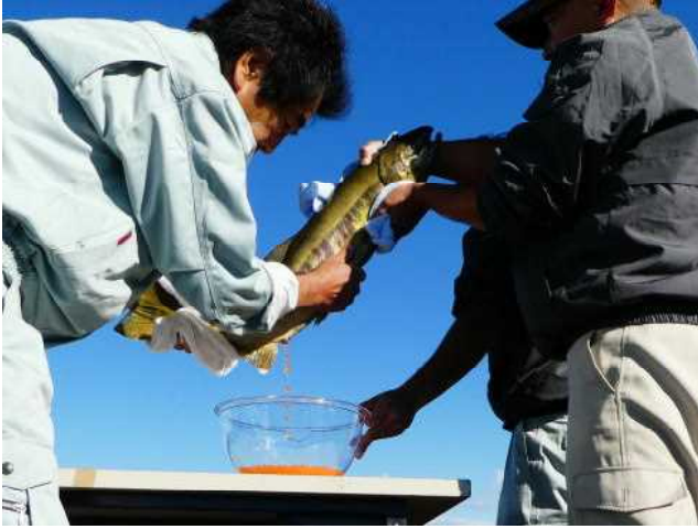
◆ サケ採卵観察作業の様子 (H29.11.11)