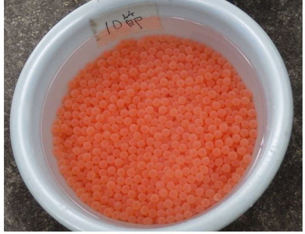
◆ 卵は受精後、 じゅせい ふか ふか をさせます