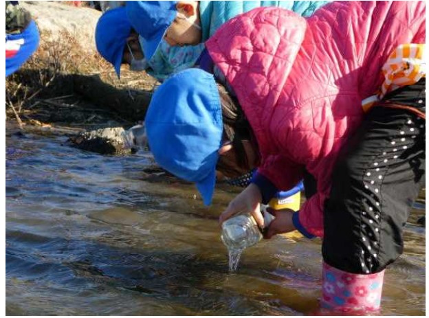
◆ サケ稚魚放流会の様子 (H29.2.15)