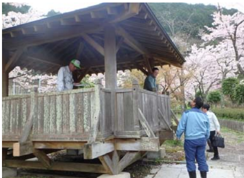
参考 【前回(平成29年4月21日(金))安全利用点検実施状況(ダム入口広場)

取材を希望される場合は、13時50分迄に阿木川ダム防災資料館(説明ホール)にお越し頂ければご案内いたします。