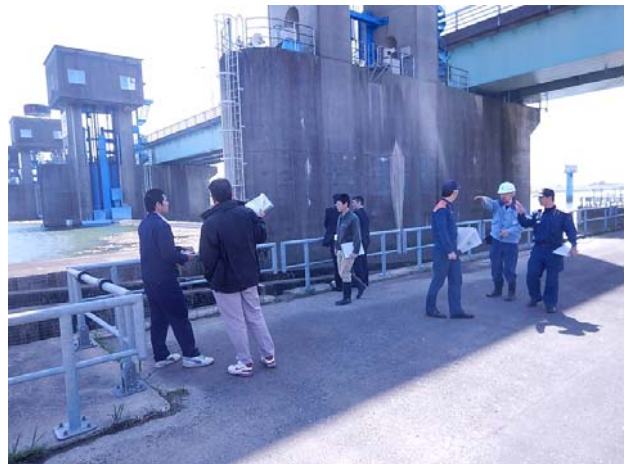
堰周辺高水敷き（右岸）