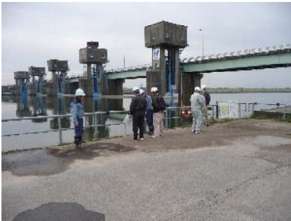
堰周辺高水敷き（左岸）