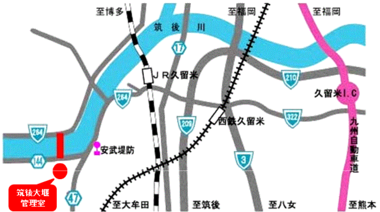
【筑後大堰管理室案内図】