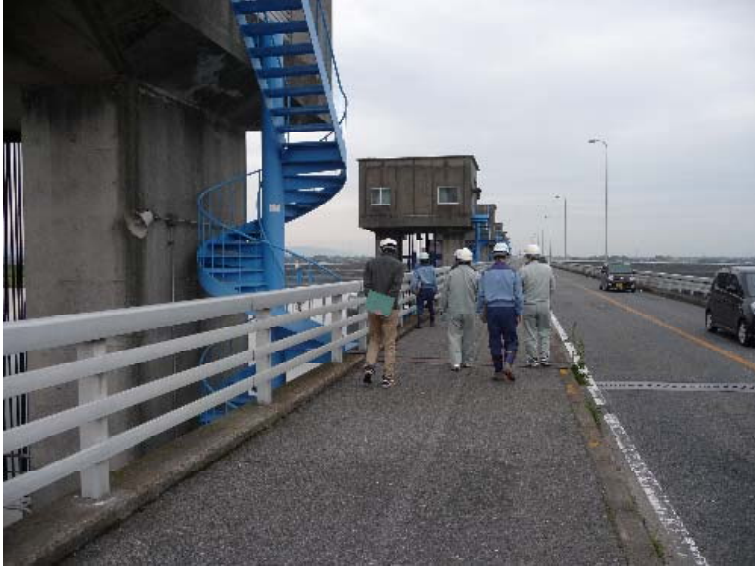
（筑後大堰管理橋の確認状況）