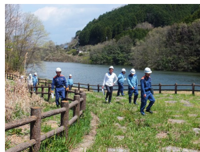
コスモス公園点検状況