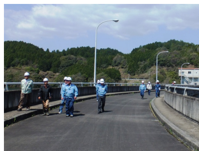
ダム堤頂部点検状況