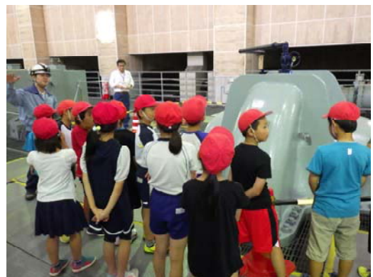
ポンプ設備の見学