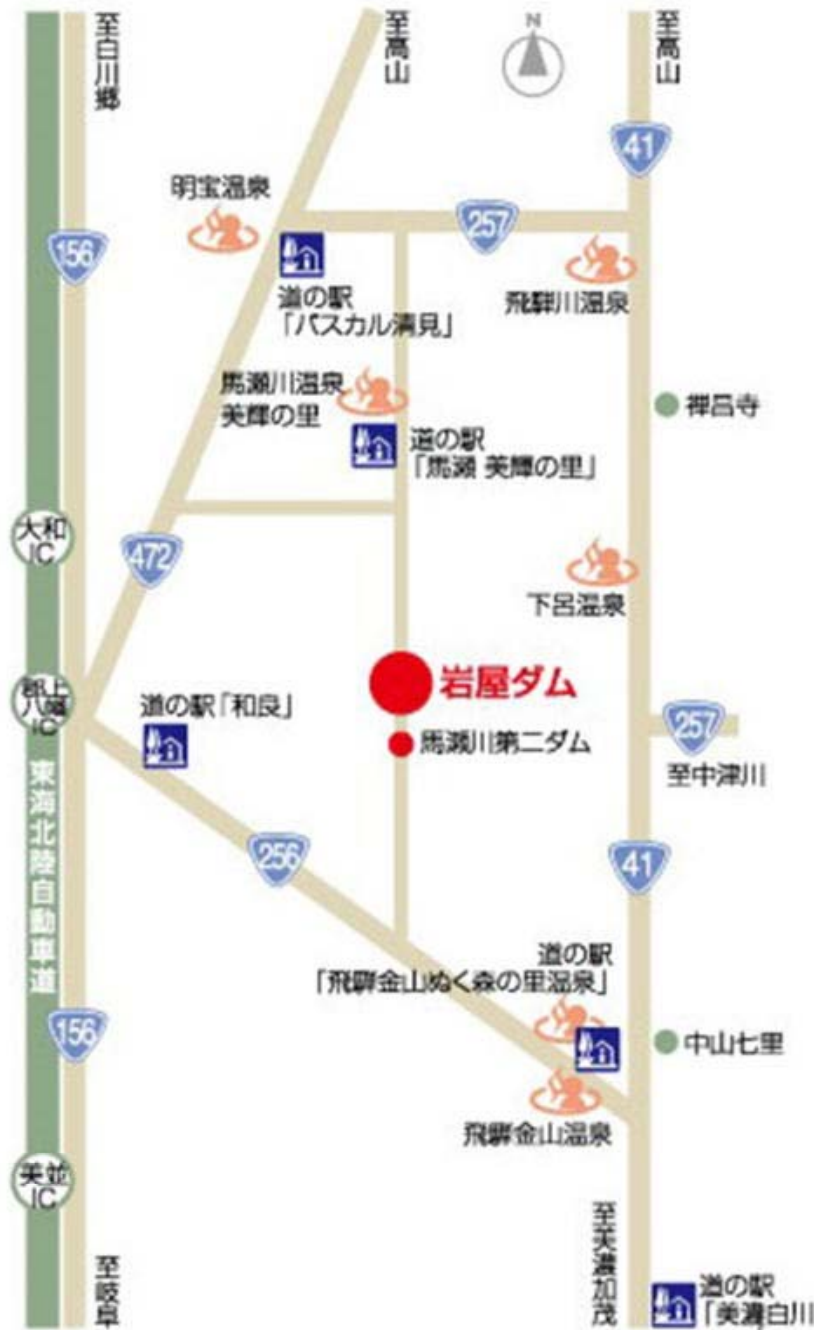
岩屋ダム map 🚗