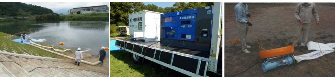
【ポンプ・ホース展開※】