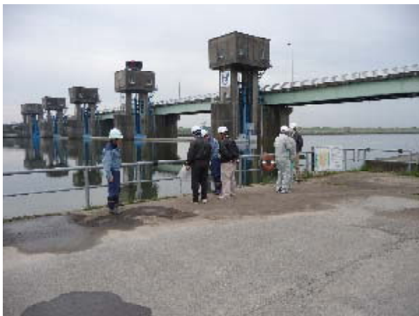
堰周辺高水敷き（左岸）