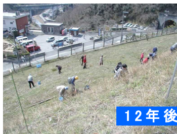
H19年3月植樹時の状況