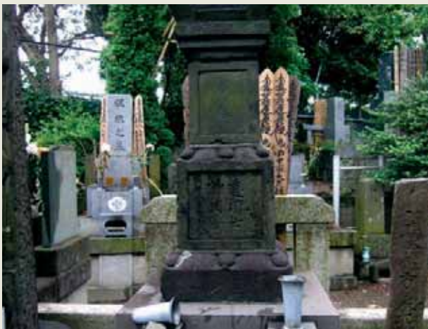
田中休愚の墓（川崎市幸区・妙光寺）

酒匂川は、休愚や婿の代官蓑笠之助が技工の限りを尽くし禹を祀る祠まで建立して、水害の根絶を企図した。だが、その後も大洪水が続き、流域の右岸・左岸の農民の対立は激化する。享保14年（1729年）、休愚は支配勘定並に登用され幕臣となって武蔵国多摩・埼玉両郡で3万石を支配したが、同年12月22日病没した。享年68。