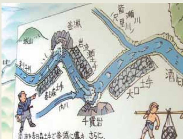
酒匂川・現場作業風景（説明板より）

将軍吉宗が『民間省要』を上覧後に田中休愚の身边には変化が起きる。同書は江戸期の民政文献として不朽の名著とされる。享保8年（1723年）に井澤弥惣兵衛の指揮下に、武蔵国大里、埼玉両郡の荒川、また荏原・橋樹郡内、多摩川及び両岸の六郷・二ヶ領用水の川除御普請御用を命じられ、10人扶持が支給された。1日につき米5升が手当として与えられた（この段階で、弥惣兵衛と休愚が知り合いの仲であったかどうかは不明である）。