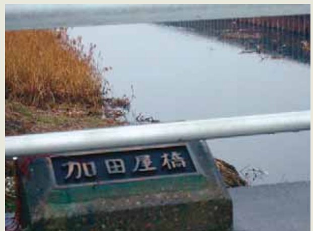
加田屋新田なごりの橋（さいたま市見沼区）

南部領の染谷村は、見沼溜井から東に水を引いている天久保用水を利用している。加田屋の入江新田が開発されて以降、水量が減って使いにくくなり、湯水の年は田植えが出来なくなった。そこで同じ南部領の膝子村と相談して、入江新田の悪水落とし堀（排水路）の末端で堰き止め、水かさを上げて染谷村で使うようになった。湯水の時には慣例となっていた。享保3年（1718年）6月9日夜、膝子村から農民たちが大勢押しかけてこの堰を切り破ってしまった。「理不尽な致し方」と染谷村は怒って対立が激化した。公儀（幕府）は何かと問題の多い入江新田を取り潰し、同新田は昔の沼に戻ってしまった。