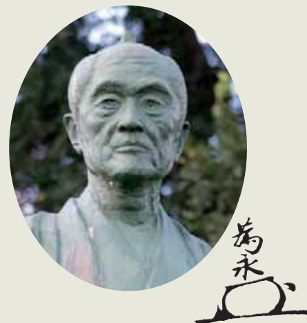
井澤弥惣兵衛為永の立像と弥惣兵衛の花押 (さいたま市見沼自然公園)