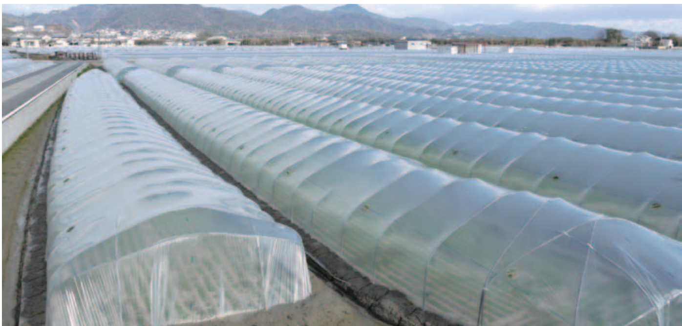
大型トンネル群 (板野町)