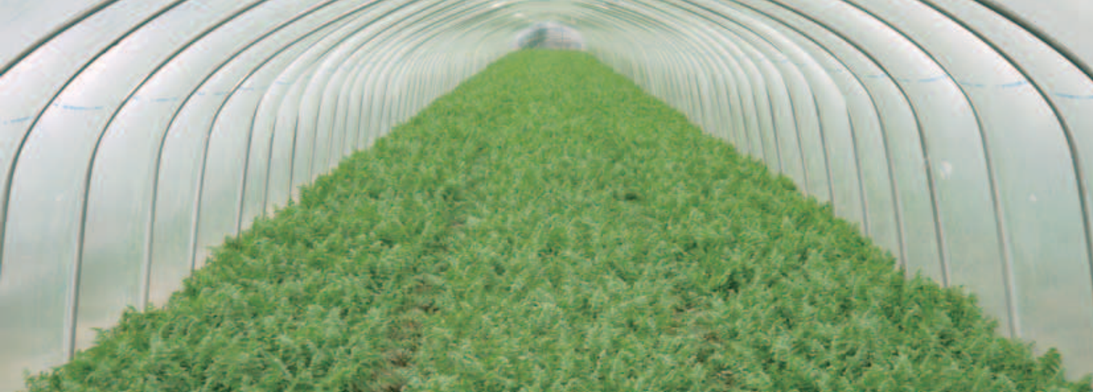
青々としたにんじんが育つトンネル内部