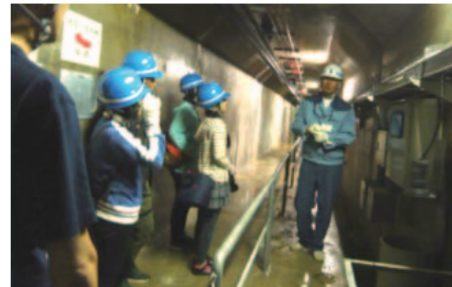
普段見ることのできない堤体内

寄附をいただいた方限定の特別施設見学会等を関東管内の機構12施設で実施しました。延べ25回の開催で計224名の皆様にお越しいただきました。